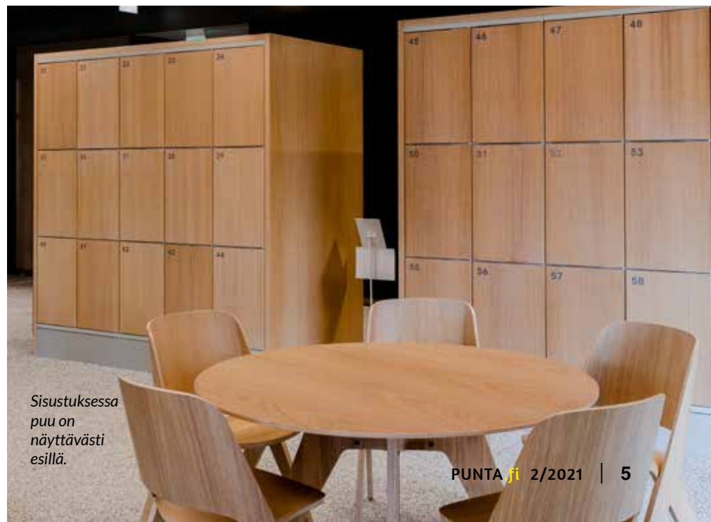
Sisustuksessa puu on näyttävästi esillä.

– Asiakas saa viimeistellyn kokonaisuuden, säilytyskaluste- ja lukitusratkaisut, jotka palvelevat heidän tarpeitaan ja täyttävät myös visuaalisuuden vaatimukset.