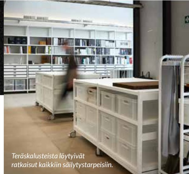
Teräskalusteista löytyivät ratkaisut kaikkiin säilytystarpeisiin.

laatikot olivat toivottu lisä pienempien toimistotavaroiden säilytykseen sekä osana materiaalikirjastoa, esimerkiksi värivihkoille ja mallipaloille. Pyörälliset hyllyt toimivat säilyttiminä ja projektipöytinä. Pyörät haluttiin muuntojoustavuuden vuoksi, koska muotoilutoimistossa tarvitaan välillä isompaa tilaa esimerkiksi hahmomallien rakentamiseen.