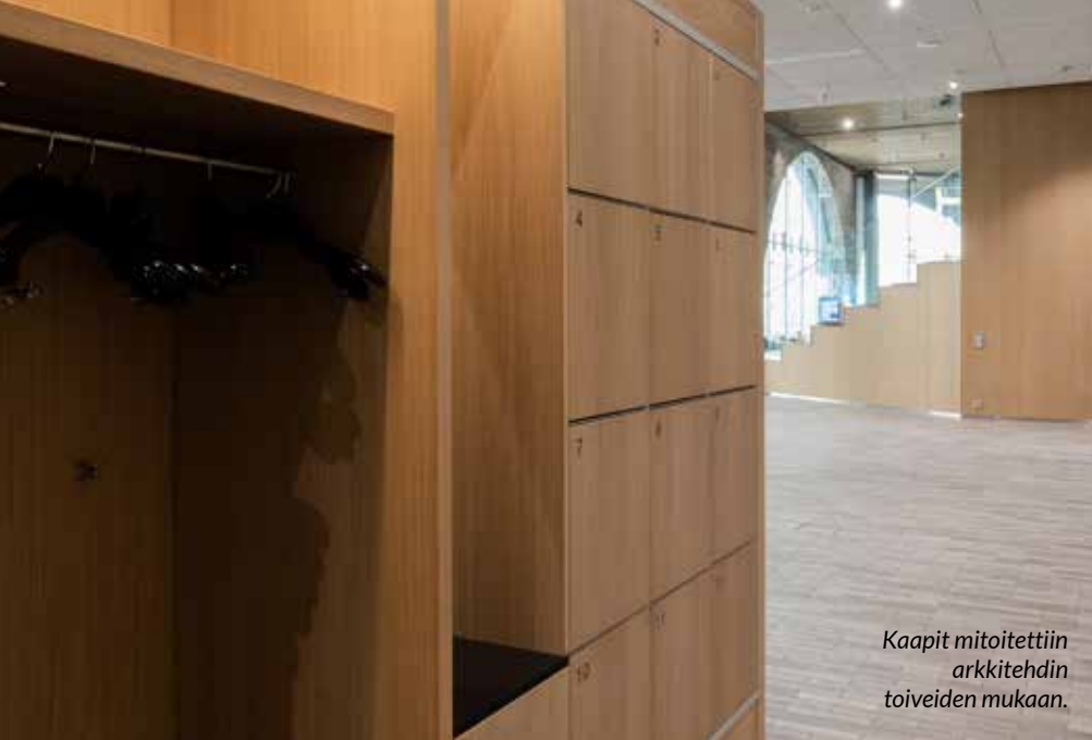
Kaapit mitoitettiin arkkitehdin toiveiden mukaan.

Yli 40 000 neliömetrin laajuinen Kaupunkiympäristön toimialan talo on ainutlaatuinen kokonaisuus, jonka suunnittelu ja rakentaminen vaati ketterää yhteistyötä Lahdelma & Mahlamäki -arkkitehtitoimiston, Skanska Talonrakennuksen ja Helsingin kaupungin kesken. Aito yhteistoiminta takasi oikeat ja nopeat päätökset niin, että iso rakennushanke eteni suunnitellusti.